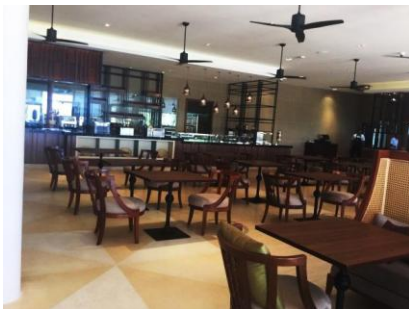
SHOOK! REST (270SEAT) ABF:06:30~10:30