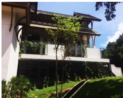
スイートルーム外観(3階立て)