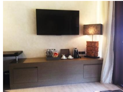
スイートルーム/液晶テレビ