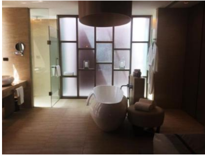
スイートルーム/バスルーム