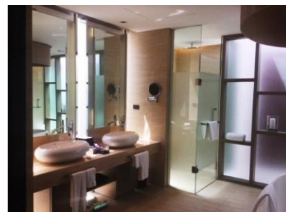
スイートルーム/バスルーム