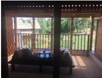
スイートルーム/バルコニー