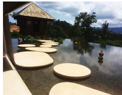
アライバルロビーからの風景