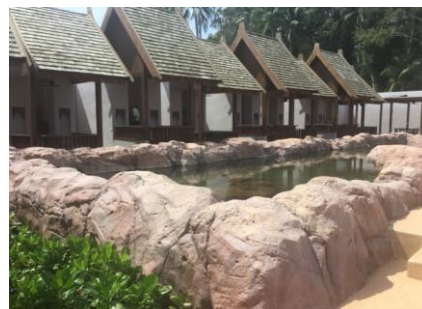
PAK THAI REST(タイ料理)