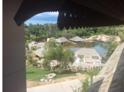
スイートルーム/バルコニーからの風景