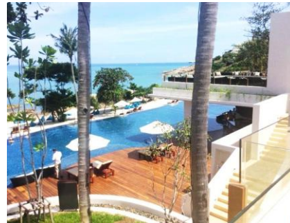
メインプール(50m+10m【子供用】)