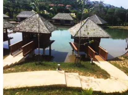
SPA(OUT DOOR ROM(3RM))