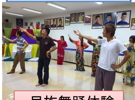
民族舞踊体験 グループ写真