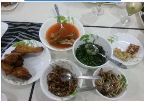
マレーの家庭料理